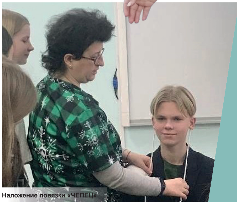
Наложение повязки «ЧЕПЕЦ»