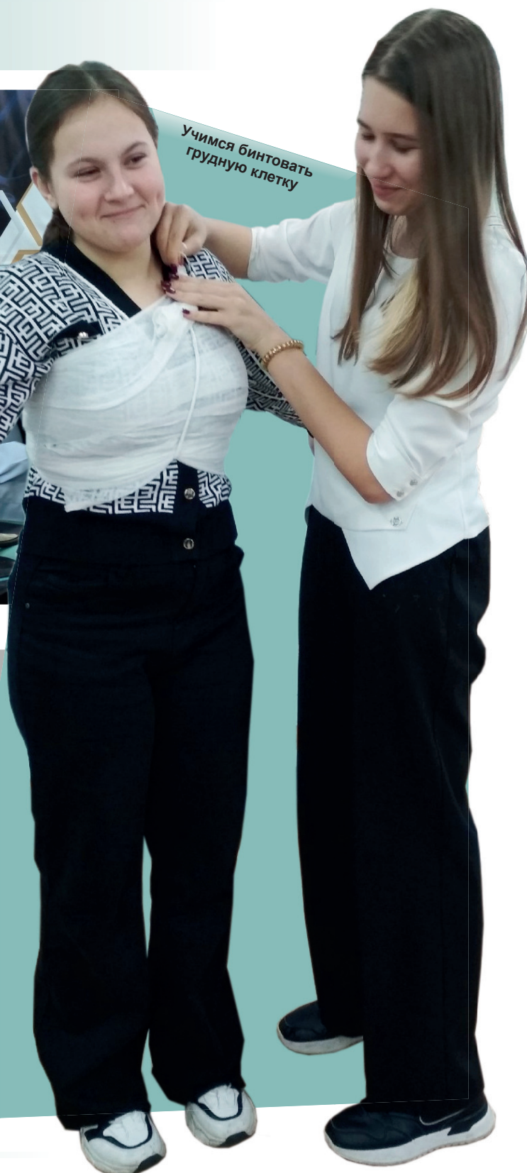
Учимся бинтовать грудную клетку