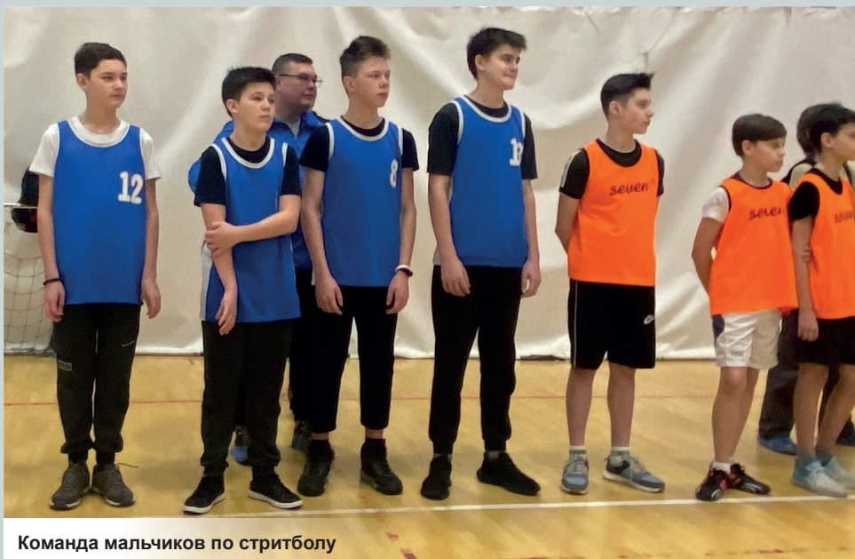
Команда мальчиков по стритболу