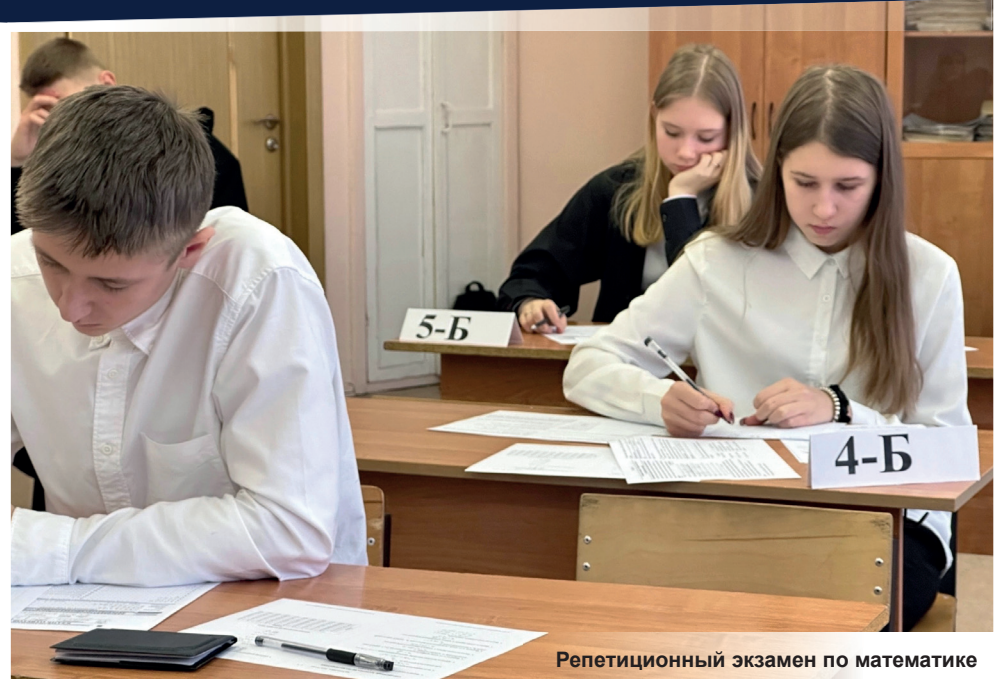
Репетиционный экзамен по математике

По окончании школы наши выпускники смогут изображать предметы окружа-